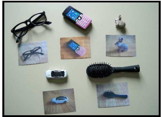
Objets et photos pour l'Appariement Objet-Photo