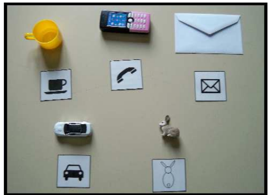
Objets et pictogrammes pour l'Appariement Objet-Pictogrammes