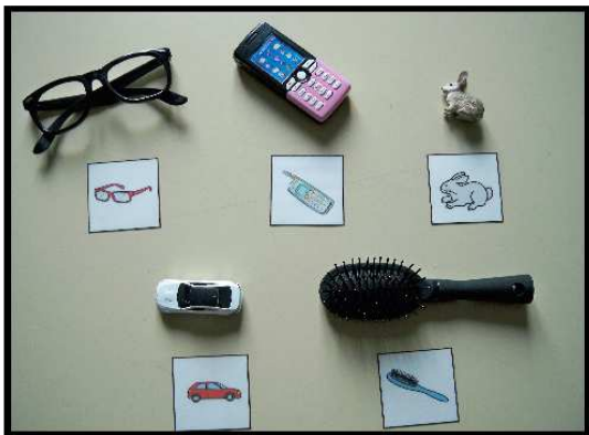
Objets et images pour l'Appariement Objet-Image