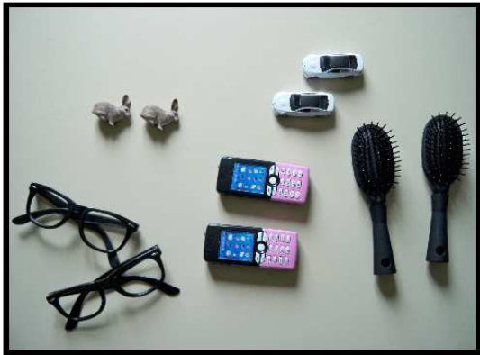
Objets pour l'Appariement Objet-Objet