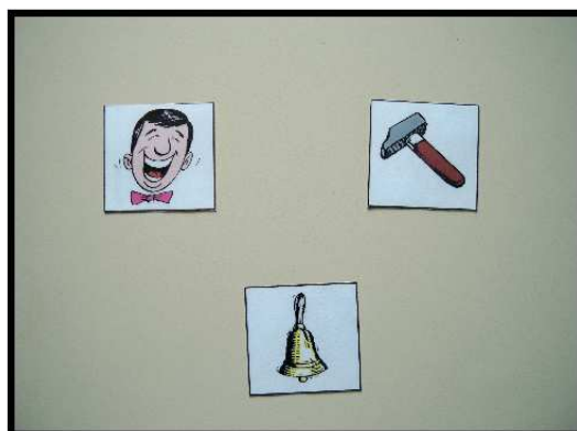
Images pour la Remise en ordre des sons : rires, marteau, clochette