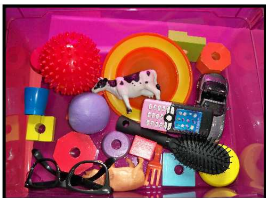
Exemple d'une boîte avec jouets pour le temps libre d'observation