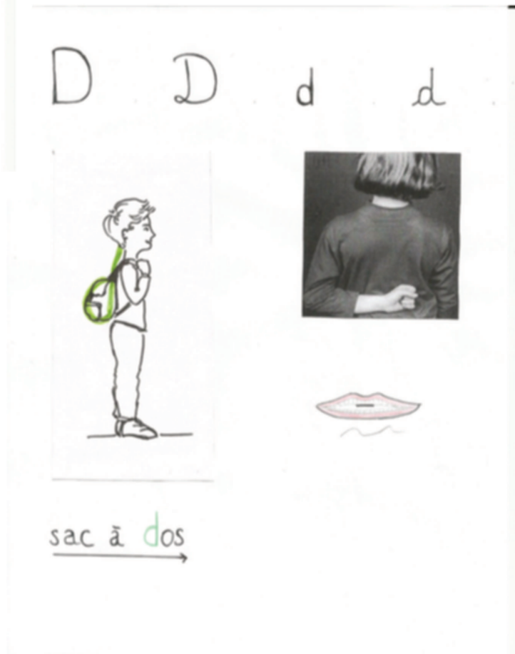
Fiche de présentation Lettre d