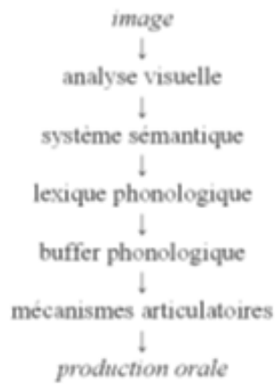
Schéma 2. Modèle du système sémantique (Levelt, 1998)