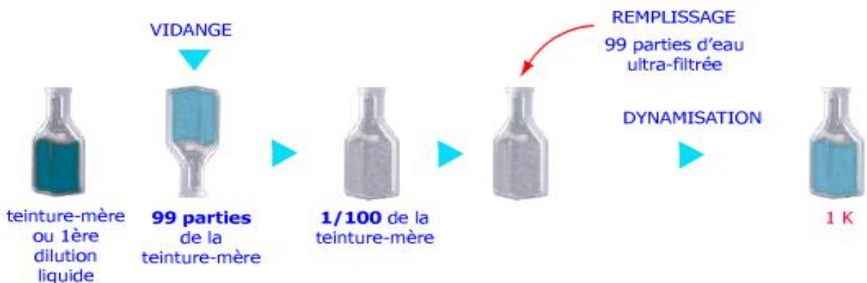
Figure 2 : Illustration du principe de dilution selon Korsakov

D'un point de vue correspondance on peut établir que 4CH=6K, 5CH=30K, 7CH=200K et 9CH=1000K.